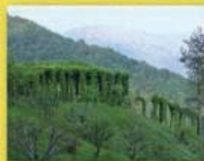
Roccolo di "Spisso"