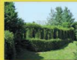
Roccolo di "Pre Checo"