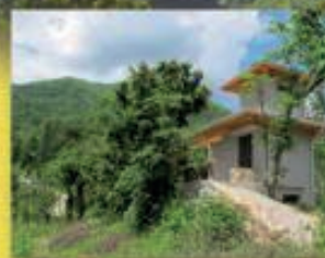
Roccolo di "Manganel"