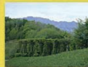
Roccolo del "Puestin"